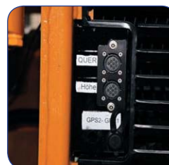
Разъемы для подключения датчиков