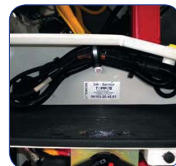
Соединительные кабели системы