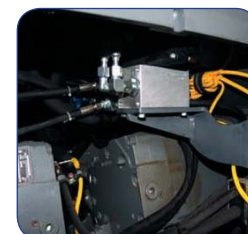
Гидравлические клапана для автоматической работы

Закажите бульдозер LIEBHERR, подготовленный для установки системы Topcon!