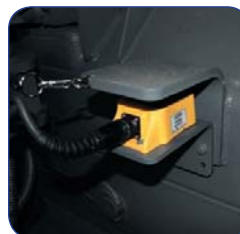
Крепления для датчика наклона или MC 2 сенсора