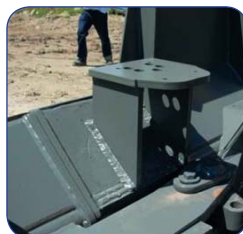
Крепления для установки мачт