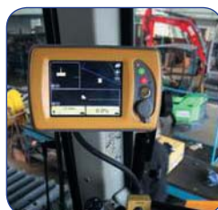
Крепления панели управления